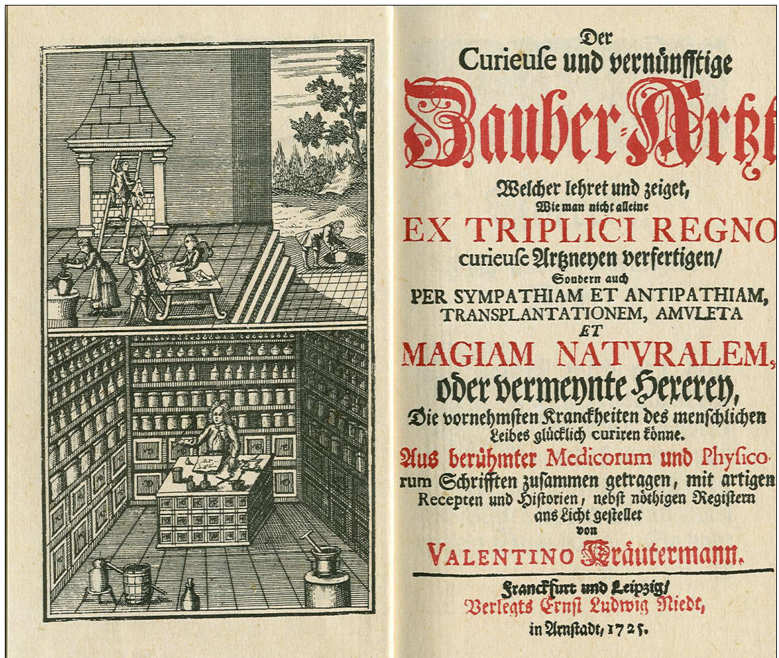
Abb.17: „Der curieuse und vernünfftige Zauber-Arzt“, 1725

gesammelten und selbsterprobten Rezepten, ihre Autoren sind studierte Ärzte und sämtliche Vorschriften unterliegen den gleichen therapeutischen Auffassungen, die einer vergangenen Denkweise entsprechen, die sich uns heute nur schwer erschließt.