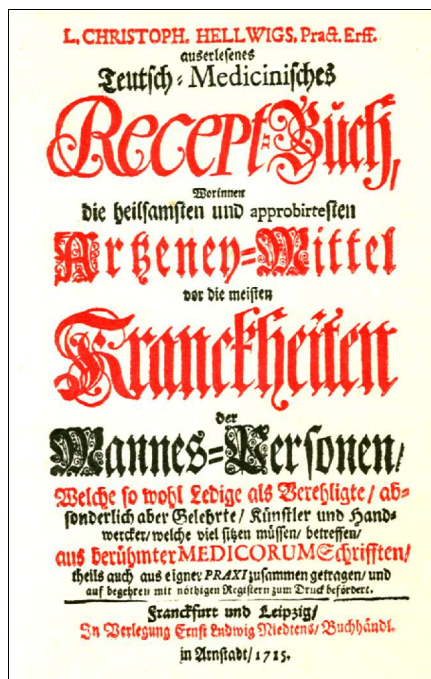
Abb.16: „Recept-Buch“, 1715

Der „Dreckapotheke“ ähnelnd, beginnt auch im „Zauber-Arzt“ die Abhandlung