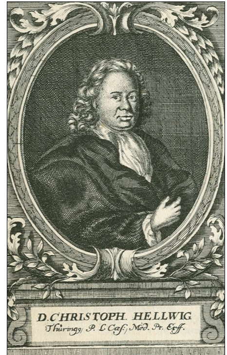
Abb.15: Christoph von Hellwig

Ähnlich wie bei Paullini, erschienen einige dieser Werke nicht unter seinem richtigen Namen, sondern unter den Pseudonymen Caspar Schröder, Constans Alitophilus Hertzberger oder auch Valentin Kräutermann. Noch Jahrzehnte nach seinem