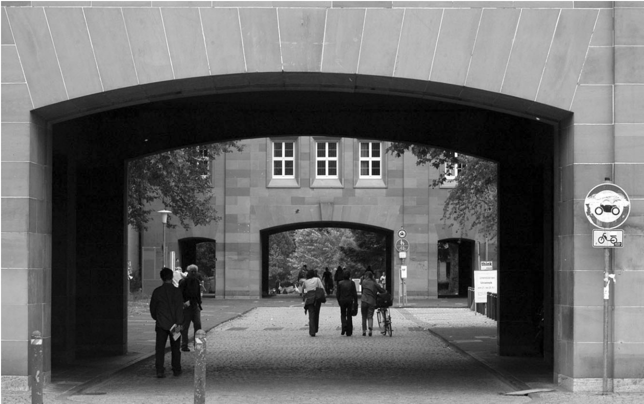
Das Forum, der Eingang zum Zwischenraum.